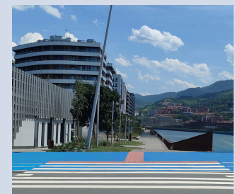
Espaces verts en bord de quai rive de San Ignazio

Les aménagements réalisés jouent des juxtapositions/ superpositions de "boîtes" en bois et laissent toute sa visibilité à la structure d'origine en béton.